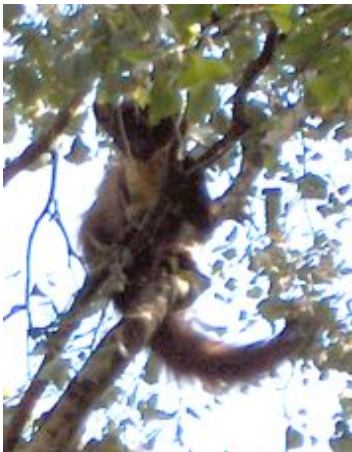
Boommarter tuin 68 NP 02/06/11