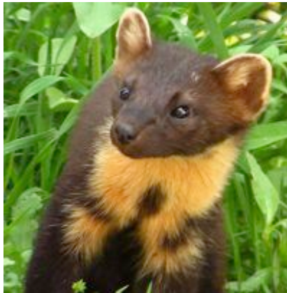
Zo is hij beter te zien (andere bron)

Begin juni wordt het ons weer helemaal duidelijk. Het Nieuwe Bijenpark is een heel uitzonderlijke plek voor ons mensen, maar ook voor veel dieren.