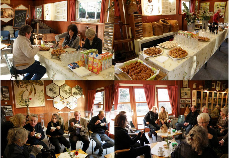
Foto's van de nieuwjaarsreceptie van 9 januari 2011.

Oh ja, het werd Nieuwjaar! Hoewel het niet bewezen is dat het helpt doe ik toch een duit in het zakje, en wens ik u een goede onderlinge relatie toe. En handelen daarnaar, en vooral veel biodiversiteit met elkaar.